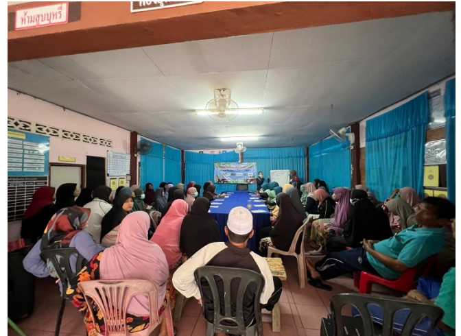
ภาพประกอบกิจกรรม