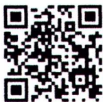
สิ่งที่ส่งมาด้วย

รองปลัดกระทรวงมหาดไทย ปฏิบัติราชการแทน ปลัดกระทรวงมหาดไทย