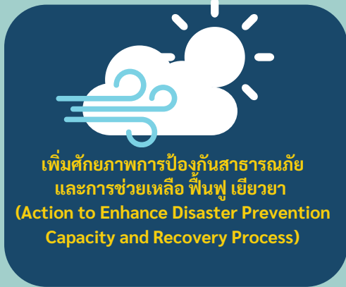
เพิ่มศักยภาพการป้องกันสาธารณภัย และการช่วยเหลือ ฟื้นฟู เยียวยา (Action to Enhance Disaster Prevention Capacity and Recovery Process)