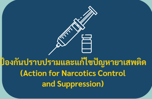
ป้องกันปราบปรามและแก้ไขปัญหายาเสพติด (Action for Narcotics Control and Suppression)