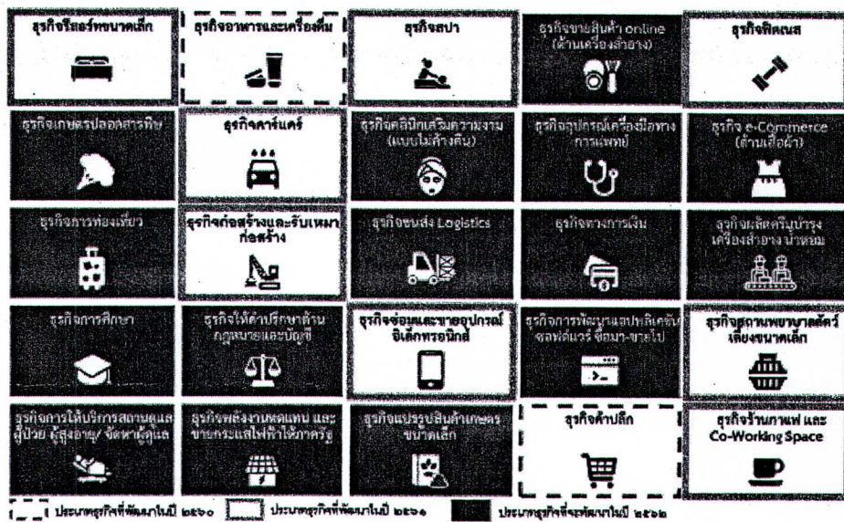
แผนภาพที่ ๑ แผนการดำเนินการพัฒนาระบบการให้บริการภาครัฐแบบเบ็ดเสร็จทางอิเล็กทรอนิกส์ (Biz Portal) เพื่อให้บริการแบบเชื่อมโยงครบวงจรใน ๒๕ ประเภทธุรกิจที่สำคัญ

โดยในปีงบประมาณ พ.ศ. ๒๕๖๒ จะดำเนินการพัฒนาระบบเพื่อให้บริการเพิ่มเติม ในเขตกรุงเทพมหานคร จำนวน ๑๕ ประเภทธุรกิจ ได้แก่ ธุรกิจผลิตครีมบำรุง เครื่องสำอาง น้ำหอม ธุรกิจคลินิก เสริมความงาม (แบบไม่ค้างคิน) ธุรกิจการให้บริการสถานดูแลผู้ป่วย ผู้สูงอายุ/จัดหาผู้ดูแล ธุรกิจพลังงาน ทดแทน และขายกระแสไฟฟ้าภาครัฐ ธุรกิจการท่องเที่ยว ธุรกิจให้คำปรึกษาด้านกฎหมายและบัญชี ธุรกิจ การพัฒนาแอปพลิเคชัน ซอฟต์แวร์ ซือมา – ขายไป ธุรกิจเกษตรปลอดสารพิษ ธุรกิจทางการเงิน ธุรกิจการศึกษา ธุรกิจขายสินค้าออนไลน์ (ด้านเครื่องสำอาง) ธุรกิจ e-Commerce (ด้านเสื้อผ้า) ธุรกิจแปรรูปสินค้าเกษตร ขนาดเล็ก ธุรกิจอุปกรณ์เครื่องมือทางการแพทย์ และธุรกิจขนส่ง Logistics รวมจำนวน ๓๐ ใบอนุญาต ครอบคลุมการขออนุญาตรายใหม่ การต่ออายุ การแก้ไข/เปลี่ยนแปลง และการยกเลิก รวมถึงการพัฒนา ระบบให้สามารถเชื่อมโยงระบบการรับชำระเงินกลางของบริการภาครัฐ (e-Payment Portal of Government)