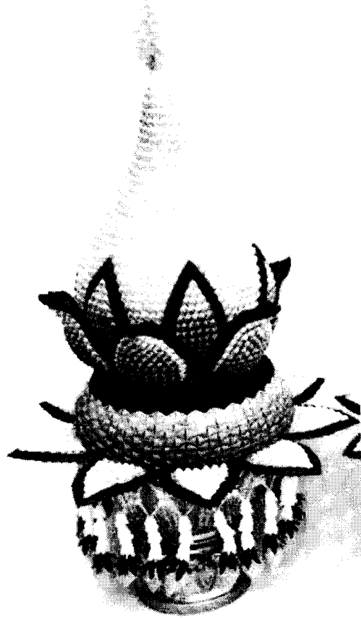
ตัวอย่างพานพุ่มถวายราชสักการะ ทรงพุ่มข้าวบิณฑ์ โทนสีเหลือง จำนวน ๑ พาน ขนาดพานกว้าง ๙ นิ้ว ดใช้อักษรพระปรมาภิไธย “ภปร”